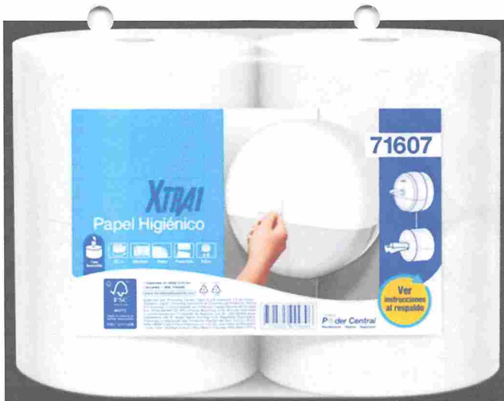
ROLLO DE PAPEL HIGIENICO JUMBO INSTITUCIONAL DOBLE HOJA 207 M (XTRA1)