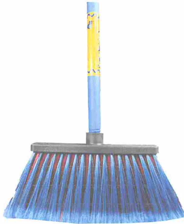
ESCOBA PLASTICA PELO LARGO