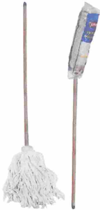
SUAPER NO. 28