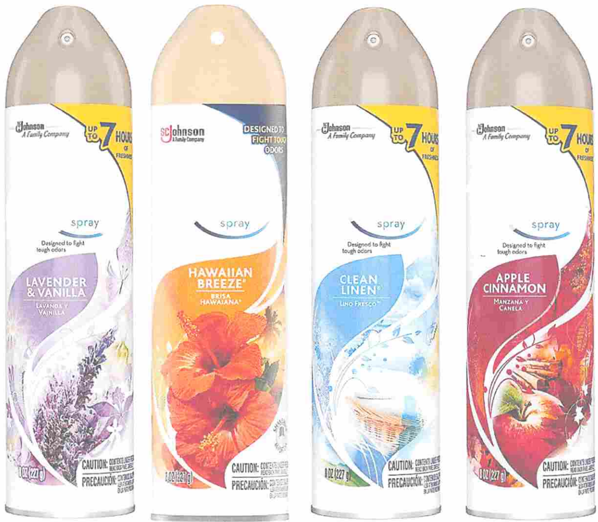
AMBIANTADOR EN SPRAY 345G/400ML DIFERENTES AROMAS