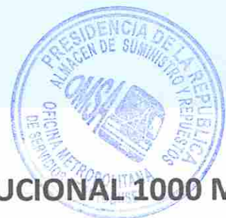
DISPENSADOR DE JABON DE ESPUMA INSTITUCIONAL 1000 ML