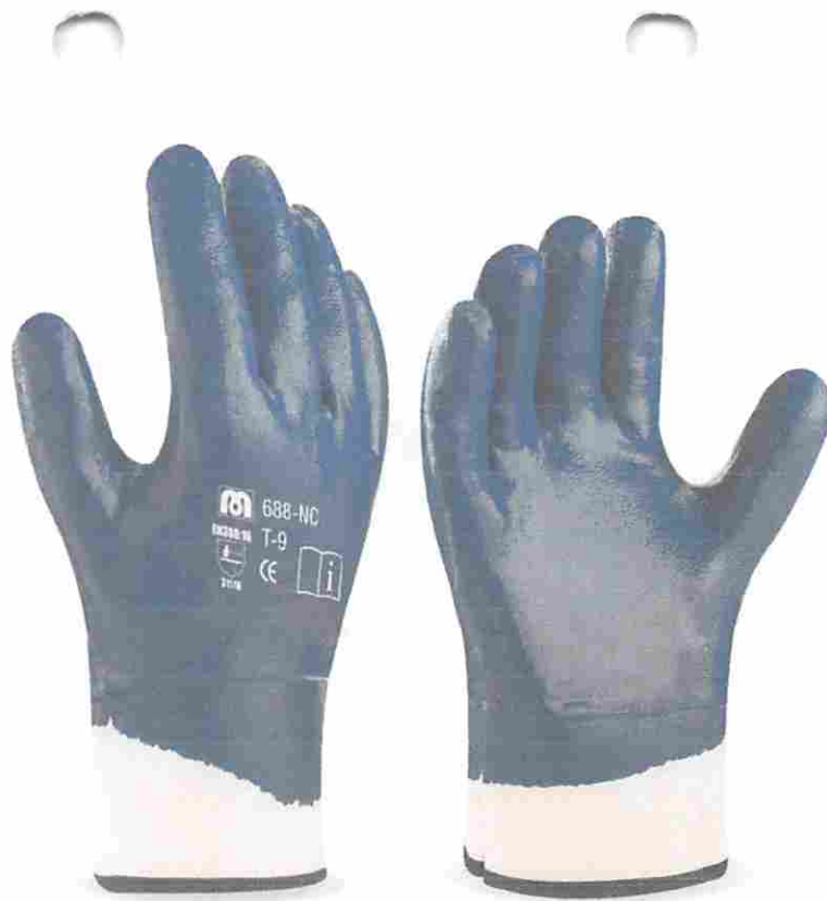
PARES DE GUANTES DE NITRILO Y LONA PIGMENTADO COMPLETO TALLA 10 CALIBRE 25