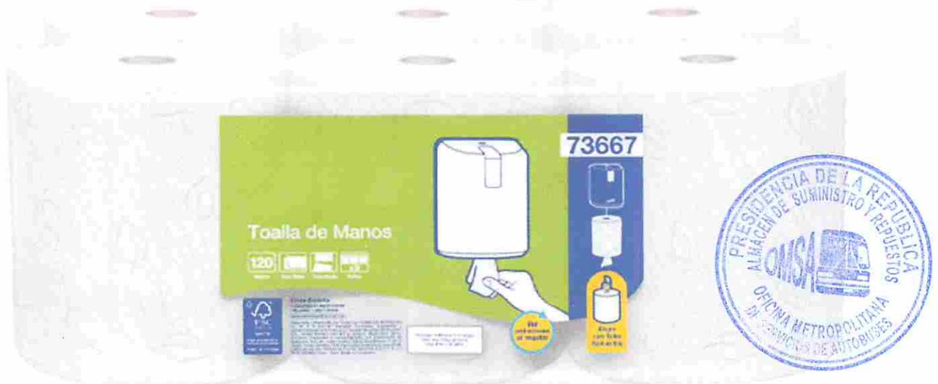
ROLLO DE PAPEL TOALLA INSTITUCIONAL FLUJO CENTRAL DOBLE HOJA 120 M