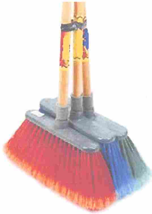
ESCOBA PLASTICA PELO CORTO