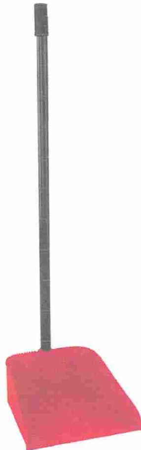
RECOGEDOR DE BASURA