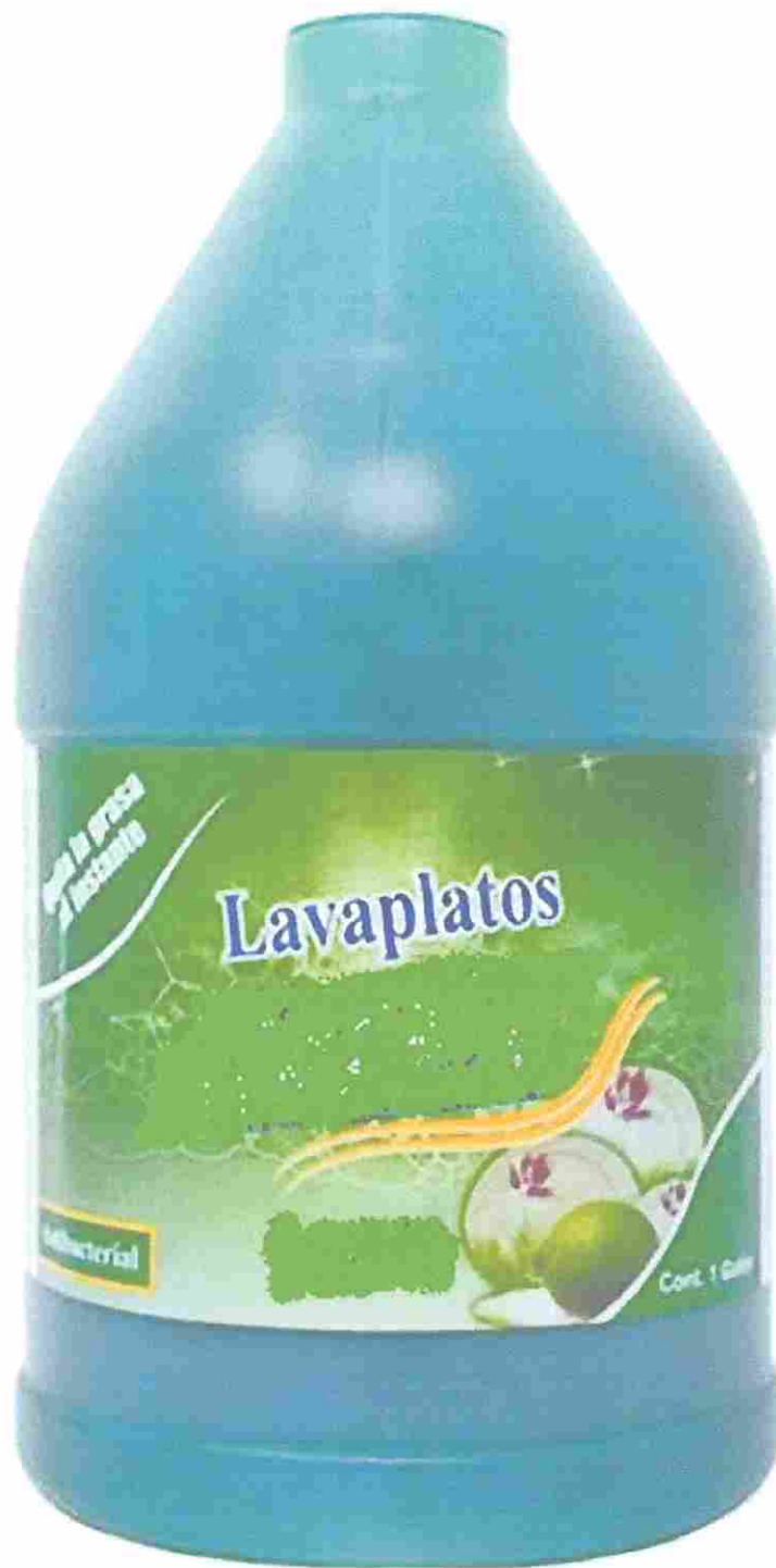
GALON DE LAVAPLATOS LIQUIDO